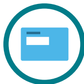
Aangifte inkomsten- belasting

De totale besparing verschilt per huishouden. Bij eerdere resultaten was de gemiddelde besparing € 400,- per huishouden.